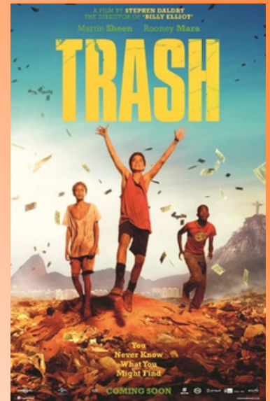
Trash - A esperança Vem do Lixo