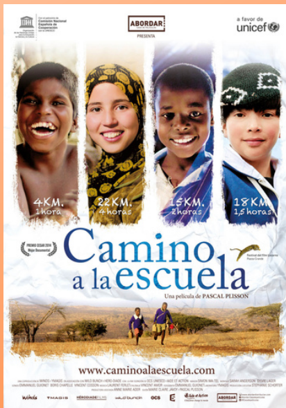
Camino a la Escuela